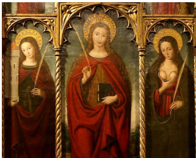
Sainte Dévote (au centre) avec sainte Agathe (à droite) et sainte Barbe par Louis BREA, peintre niçois du 16 e siècle (détail du Retable de Dolceacqua)

Dieu, nous Te louons, Dévote nous T'acclamons Notre sainte Patronne, prie pour la Corse !