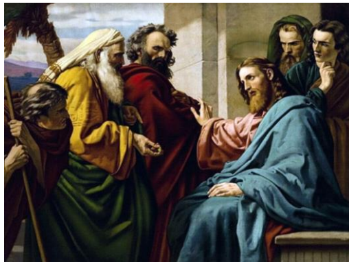
Jésus et les sadducéens, par Ernst Karl Zimmermann (1900)

Introit: Intret oratio mea in conspéctu tuo; inclina aurem tuam ad precem meam, Dómine.