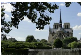
Notre-Dame de Paris rue de l'Île Saint-Louis

Saint Louis avait désiré mourir un samedi, pour honorer la Vierge Marie dans sa mort comme il l'avait fait pendant toute sa vie terrestre, en particulier par l'achèvement de la Cathédrale Notre-Dame de Paris ; et cette grâce lui fut accordée : c'est le samedi 25 août 1270, 8 e et dernière croisade qu'il reçut et fit couronner par Royaume des Cieux. Il fut