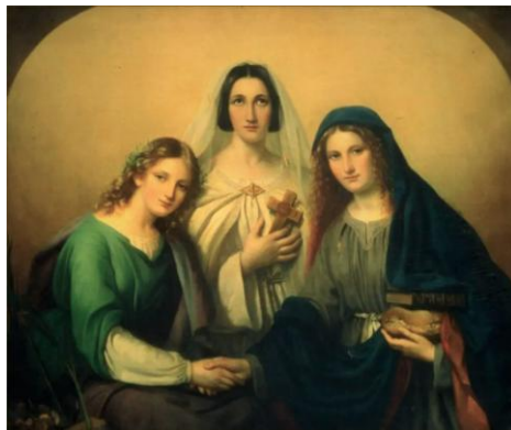
Les Vertus théologiques : la Foi, l'Espérance et la Charité par Adèle Kindt (1840)