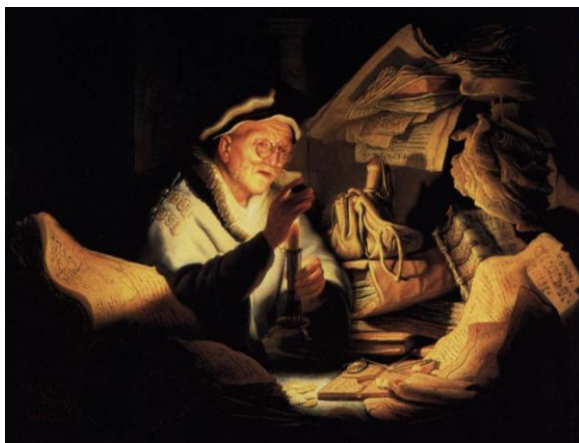
Le riche insensé