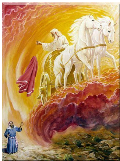
Les prophètes Élie et Élisée

Introit: 'Omnes gentes, pláudite mánibus, iubiláte Deo in voce exsultatiónis.'