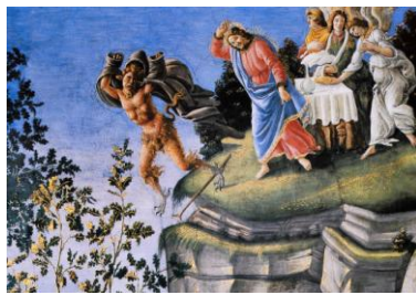
Les tentations du Christ

par Sandro Botticelli +1510 (Chapelle sixtine, détails)