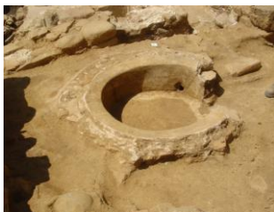
Baptistère de la première Cathédrale d'Ajaccio (6 e siècle) découvert en 2005 dans le quartier Saint-Jean

Pour vivre dans la liberté des enfants de Dieu, renoncez-vous au péché ? JE RENONCE ! Pour échapper à l'emprise du péché, renoncez-vous à tout ce qui conduit au mal ? JE RENONCE ! Pour suivre Jésus, le Christ, renoncez-vous à Satan qui est l'auteur du péché ? JE RENONCE ! Croyez-vous en Dieu, le Père tout-Ciel et de la Terre ? JE Jésus-Christ, son Fils qui est né de la Vierge passion, a été enseveli, les morts, et qui est Père ? JE CROIS ! l'Esprit-Saint, à la catholique, à la au pardon des péchés, à la résurrection de la chair, et à la Vie éternelle ? JE CROIS !