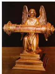
La Relique du Précieux-Sang

Depuis cette époque, la relique la magnifique coupole octogonale de l'église de au XI e siècle par des seigneurs de l'église du Saint-Sépulchre de sainte relique, les souverains l'origine de grandes faveurs à Mgr André Frémot, institua une confrérie du après, le pape Grégoire XV approuvait et enrichissait de nombreuses indulgences.