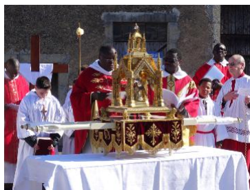
Le Reliquaire du Précieux-Sang de Neuvy

En 1865, l'ancienne Sang fut relevée par d'Auvergne, évêque Mgr Dubois obtint du accède au rang de siècle, le pèlerinage du rassemblait des fidèles, aujourd'hui lundi de Pâques.