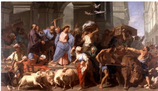
Les vendeurs chassés du Temple par Jean-Baptiste Jouvenet (1664-1749)