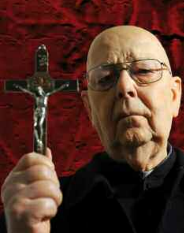
L'exorciste Père Gabriel Amorth.