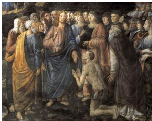
Jésus guérit un lépreux (détail) par Cosimo ROSSELLI (Florence +1507)

Nous Te chantons, Agneau de la Pâque éternelle Nous Te louons, Victime immolée par nos péchés. Nous Te chantons, Tabernacle de l'Alliance Nouvelle Nous Te louons, ô Pierre angulaire, Rocher d' Israël.